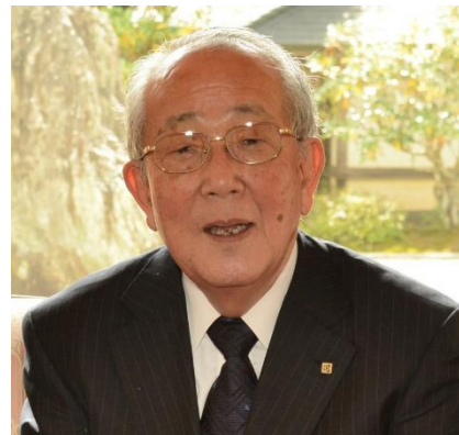
稲盛 和夫 氏

地元和歌山で真摯に企業経営に取り組んでおられる皆様、ぜひ一度、盛心塾和歌山例会へご参加ください。