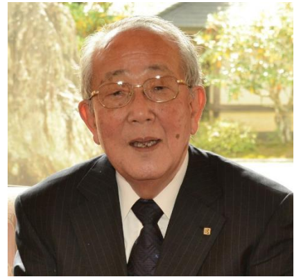
稲盛 和夫 氏

地元和歌山で真摯に企業経営に取り組んでおられる皆様、ぜひ一度、盛心塾和歌山例会へご参加ください。