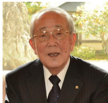
稲盛 和夫 氏

地元和歌山で真摯に企業経営に取り組んでおられる皆様、ぜひ一度、盛心塾和歌山例会へご参加ください。